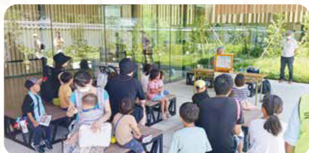
▲昨年度の様子(ボランティア団体による催し) たくさんの方にご来場いただき大盛況でした!

自分たちが暮らしている地域の「ふくし(ふだんのくらしのしあわせ)」やボランティアのこと、市社協のことなどを少しでも知っていただけるよう、楽しいイベントをたくさん準備してお待ちしております!ぜひお越しください!