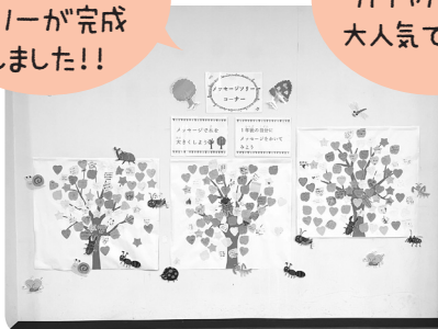
メッセージツリー