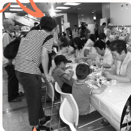
手作り工作の様子