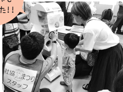
クイズラリー景品交換所