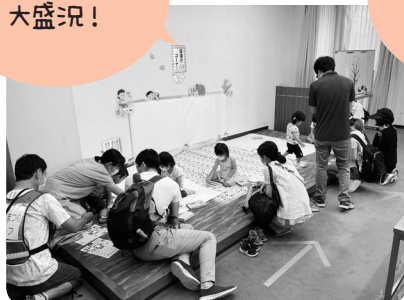
らくがきコーナー