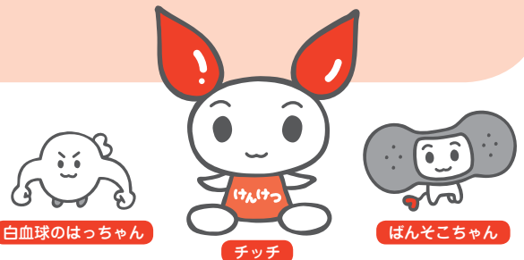
白血球のはっちゃん