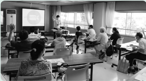
ボランティアステップアップ講座の様子