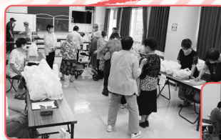
▲お弁当はお持ち帰り! (大冠地区)

活動では消毒や三密を避けるなど基本的な対策を徹底したうえで、「どうすればできるか?」と考え、工夫しながら活動をしています。