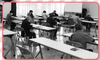
▲ぬり絵に集中!(赤大路地区)

東京オリンピック・パラリンピック、華やかなスポーツの祭典が閉幕した。様々な論議がなされた中、1年間の開催延長や無観客などの感染予防対策等がなされたものの、いまだ新型コロナウイルス感染症終息が見えない状況での開催は、さぞ苦労が多かったことと思えます。各国の選手はもちろん、ボランティアや関係するスタッフ等には労いと感謝の気持ちでいっぱいです。▼毎日の感染者数・重症患者数の動向を見ては深いため息。感染予防のやむを得ない措置とはいえ、飲食店を中心とした商業施設への「休業要請」が市内地場産業に与える影響を考えると胸が痛みます。▼「コロナ禍」という言葉でよく目にするようになった「禍」という文字ですが「禍福は糾える縄の如し」は、史記・南越伝にある言葉。より合わさった縄のように「不幸と幸福」「不運と幸運」「災いと幸い」は変転するものだとええです。たとえ今は苦しくても、またいいことが訪れますように…。