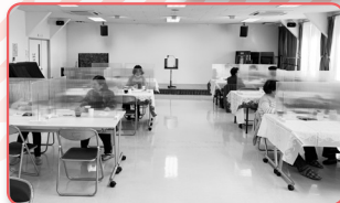
▲間仕切りをしておしゃべりを楽しめます! (北大冠地区)