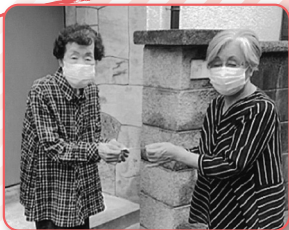
▲直接お届けしました! (西大冠地区)