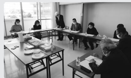
おせち料理選考会の様子