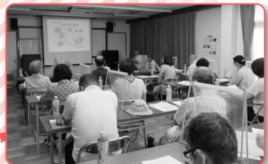
▲ボランティア研修でスキルアップ! (北清水地区)