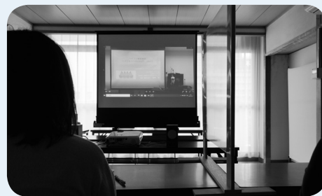
昨年度は一部オンライン形式で開催しました

*新型コロナウイルス感染症の影響により、開催内容が変更または中止となる場合があります。