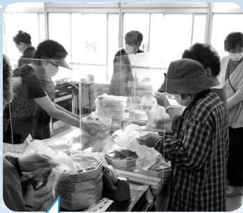
お弁当配布の準備もボランティアの皆さんが感染症対策を実施したうえで行っています。(寿栄川添地区)

いただいた住民会費と一般賛助会費の60%は右のような地区福祉委員会の活動費として、残りの40%と特別賛助会費は、社協の福祉事業やPR活動等に活用しています。