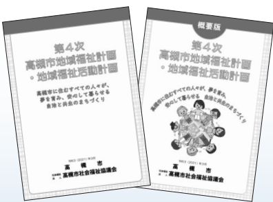
本冊子と概要版の2種類があります