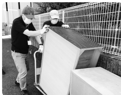
生活支援ポーターの活動の様子