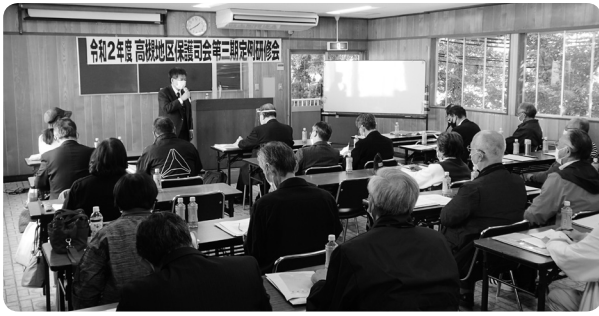
高槻地区保護司会第三期定期研修会

第4次高槻市地域福祉計画・地域福祉活動計画の策定については、市と協働して取り組み、高槻市社会福祉審議会地域共生社会推進部会での審議、並びに本協議会事業推進部会での検討を経て策定することができました。