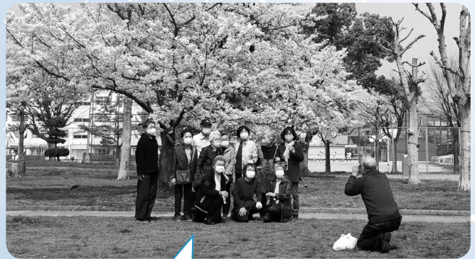
今年のお花見会は満開の桜が咲く公園をお弁当受渡しのゴールにして、小グループごとに分かれて散歩しながら向かいました。工夫をして徐々に皆さんの笑顔に出会いました。(桃園地区)