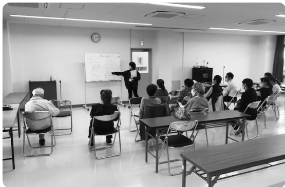
定例会 コミュニティボランティア(コミボラ)

CSW事業では、対面による相談支援が難しい中でも継続して相談支援を行いました。ひきこもり当事者・家族の居場所づくり事業「ハイファン」は、感染拡大が緩和された時期に合わせて定例会を6回、家族教室については動画配信等を活用しながら4回開催し、食品預託払出事業は、新型コロナウイルスの影響を受けた世帯を始め、28件の払出を行いました。