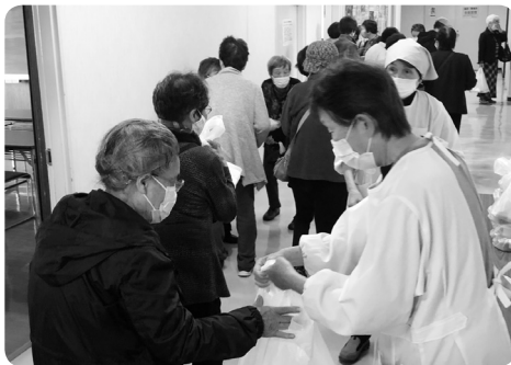
食事ももち帰りです

最後に、新型コロナウイルス感染症の影響による生活様式や働き方の変化等を踏まえ各種事業を展開します。