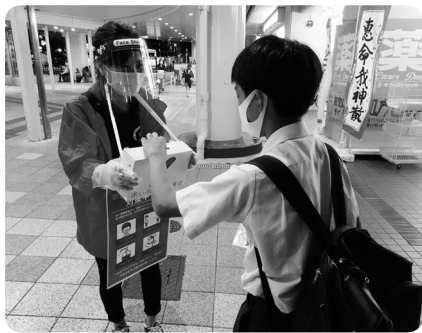
感染予防対策をしての街頭募金

皆さまのあたたかい善意により、昨年も赤い羽根共同募金（10月1日～12月31日）と歳末たすけあい運動（11月20日～12月20日）を実施することができました。 10月1日・11月30日には街頭募金を、また、自治会、法人、個人など多くの方々から様々な形の募金と支援をいただき、コロナ禍でもあたたかい思い、つながりを感じることができました。 皆さまからお預かりした募金は、地域の福祉活動への助成や災害時の準備金等として積み立てられます。ありがとうございました。