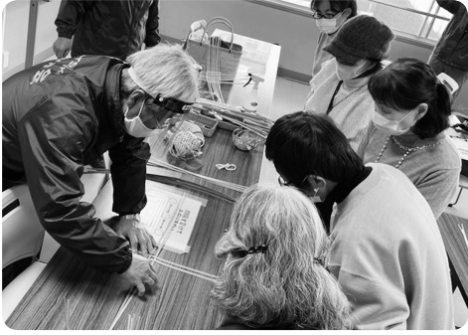
ふたばサロンで竹かご作り

市の「第4次地域福祉計画」と一体的に「第4次地域福祉活動計画」を策定し、地域共生社会の実現を目指し、 ① 地域生活課題や福祉ニーズに対応できるよう、団体や専門機関、行政等と連携をし、支援体制を構築する。 ② 大阪府北部地震の経験を活かして、平常時から地域住民やボランティア、関係機関・団体との連携を図る。