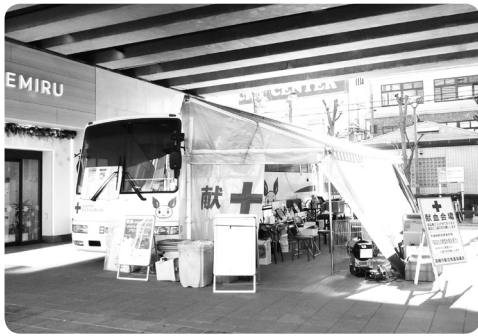
献血バスでお待ちしております

▽日時／5月13日（木）10時〜16時30分（正午から13時迄は除く） ▽場所／エミル高槻 ▽問い合わせ／保健福祉振興課 ☎674-7163