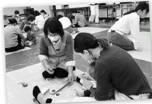
子育てサロンで楽しい工作