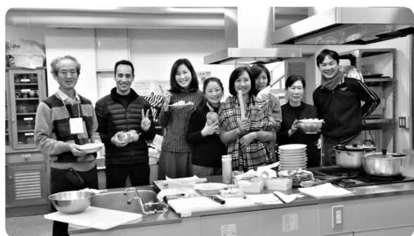
料理を作ることで国際交流を深めるイベント

皆様からいただきました善意銀行の寄付金によって、払い出し事業を行っております。今までに払い出しされた事業内容は、下記のとおりです。