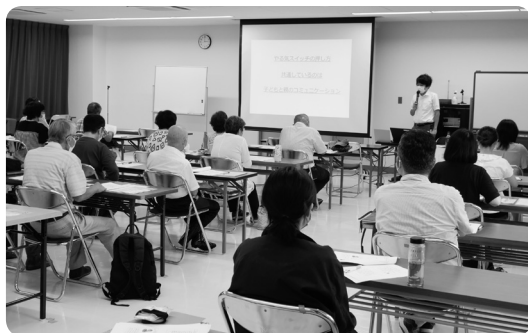
ハイフン家族教室

⑨ 5年毎の開催となる「社会福祉大会」を、社協ならびに地域福祉の活動強化に繋げ福祉の心を育む意義ある事業とするため、大会実行委員会を設け、実施