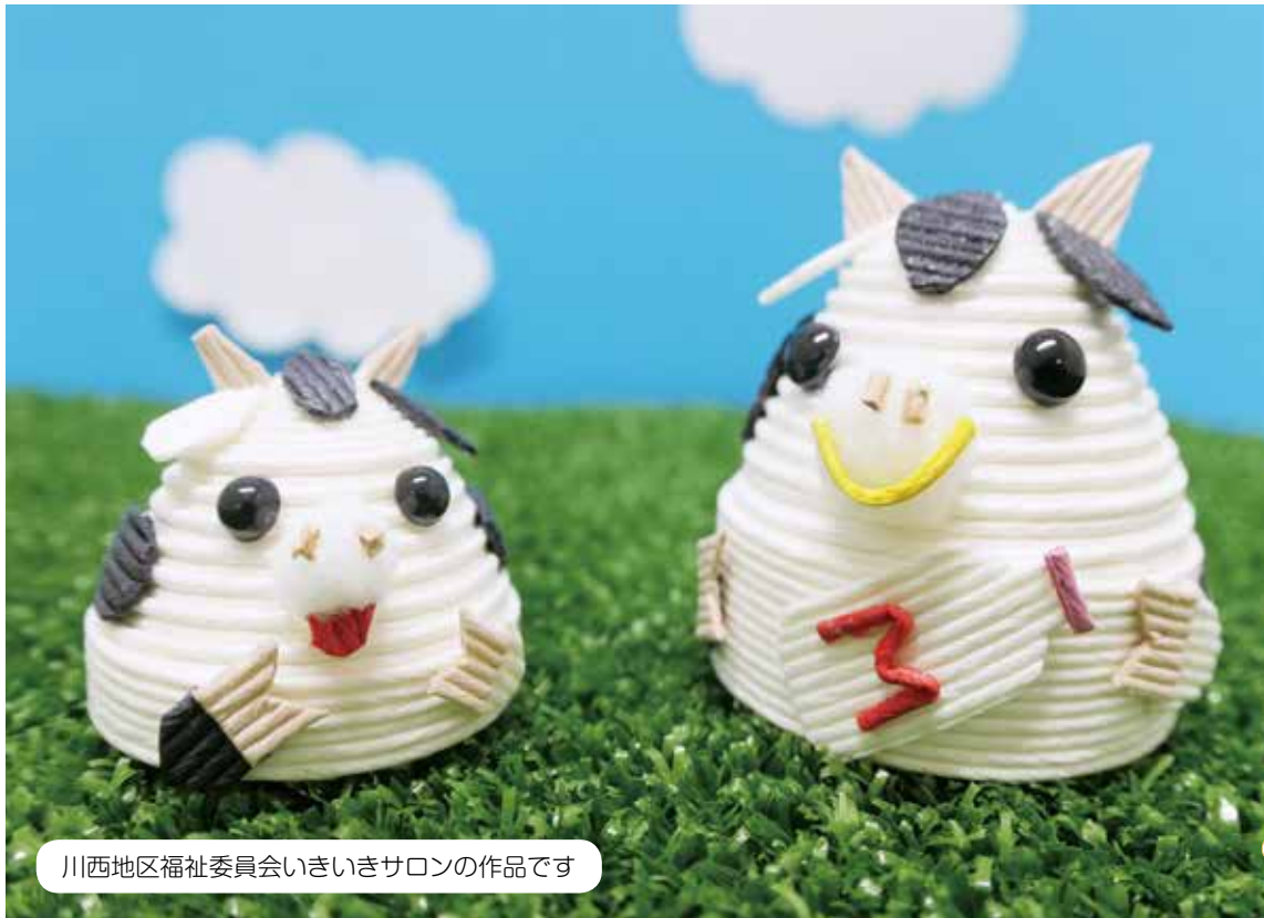
川西地区福祉委員会いきいきサロンの作品です