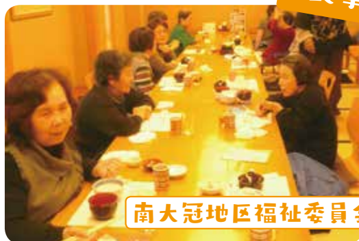
南大冠地区福祉委員会