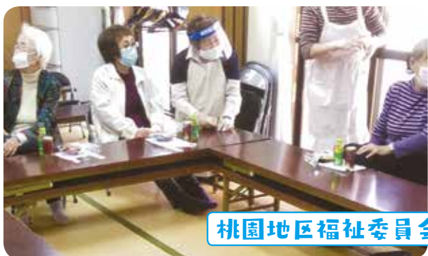
桃園地区福祉委員会