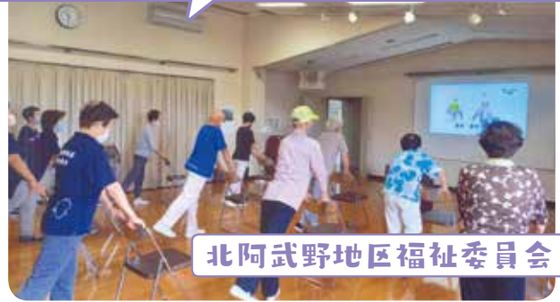
北阿武野地区福祉委員会