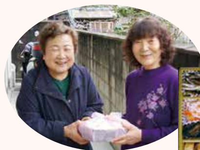
▲おせち料理を配食している様子 (昨年度)

募金額 4,748,120円 うち街頭募金額 20,332円 (令和2年12月5日現在)