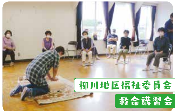
柳川地区福祉委員会