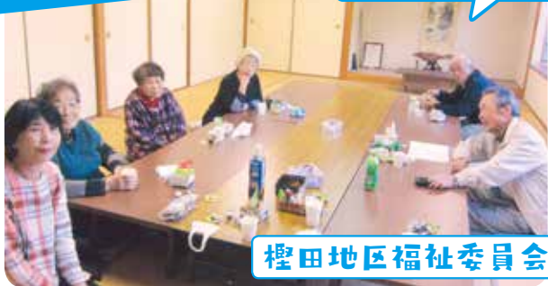
檀田地区福祉委員会

どの地区も感染対策をしながら集まりました。 撮影のために少しでもマスクを外して写真を撮りました。