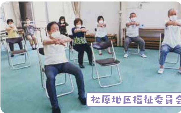
松原地区福祉委員会