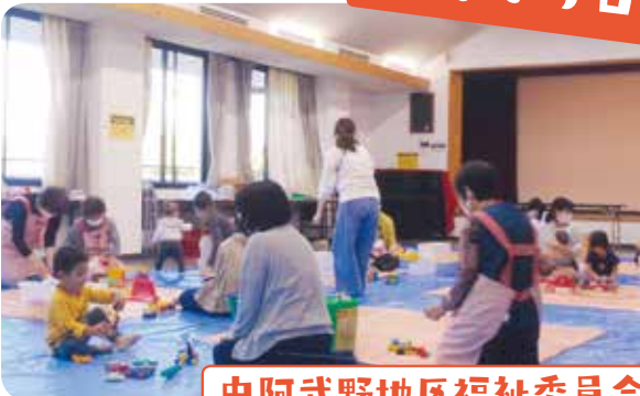
中阿武野地区福祉委員会