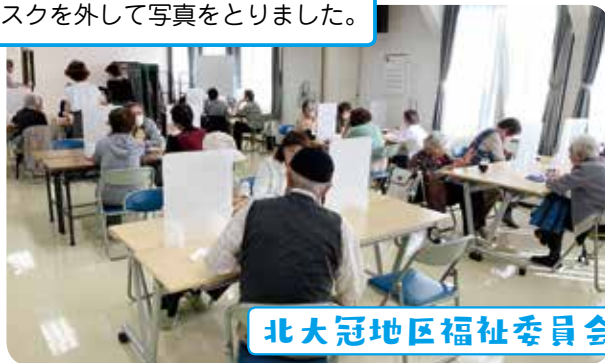
北大冠地区福祉委員会