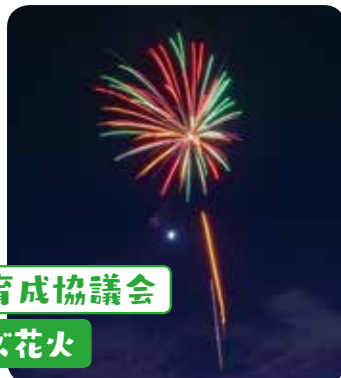
川西地区青少年健全育成協議会