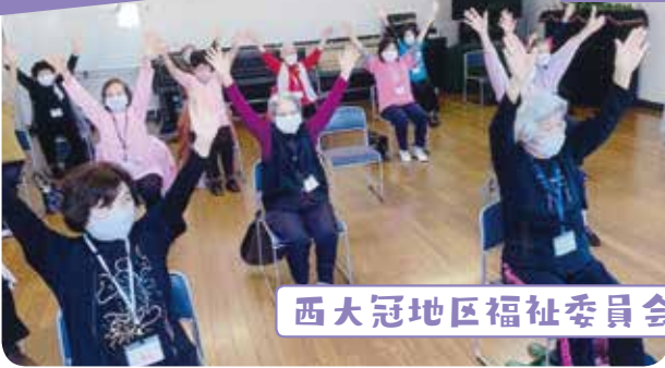
西大冠地区福祉委員会

新型コロナウイルス感染拡大防止を図るため、距離をとる、参加者を2班に分け、実施時間は1班1時間とするなど工夫を凝らして地域での活動をしました。