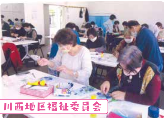
川西地区福祉委員会