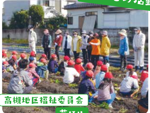
高槻地区福祉委員会