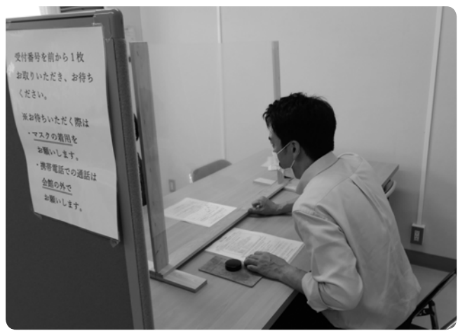
受付は感染防止に配慮して行っています

新型コロナウイルス感染症に対する取り組みとして、大阪府社会福祉協議会より受託している大阪府生活福祉資金貸付事業において、3月25日から新型コロナウイルス感染症特別貸付（緊急小口資金・総合支援資金）の相談に対応しました。