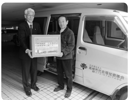
高槻市日中友好協会からマスクの寄付

市内の保育・児童・障がい・高齢の福祉施設の人事担当者による説明会を実施します。福祉施設で働きたい