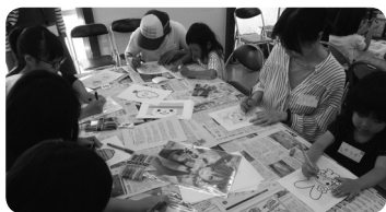
はにわキッチン@つのえの様子

あゆむでは、社会的孤立や貧困問題など多様化する地域のニーズを捉えて、各分野の福祉施設の強みを生かしながら、幅広い活動を展開しています。