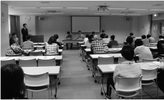
昨年の就労支援セミナーの様子

働くことに踏み出せないなどの悩みを抱えている方やその家族・関係者などに対し、同じ悩みを抱えていた若者がどのように就労への一歩を踏み出したのか、体験談を交えて個別相談会も実施します。