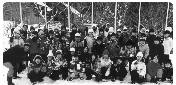
青少年健全育成会 雪遊び