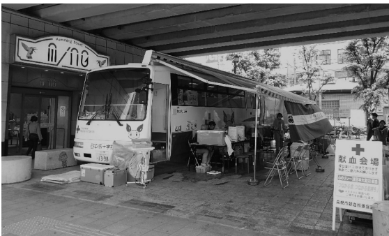
献血にご協力をお願いします！