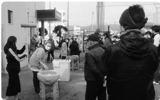
冠地区福祉委員会 もちつき大会

地区福祉委員会では、地域が少しでも良くなるように、人と人がつながる様々な事業を行っていますので、ぜひご参加ください。