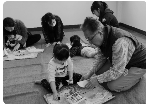
西大冠地区福祉委員会 子育てサロン

▼コーデイネーター体制の強化▼各種講座やサロン活動の実施▼子育て中の保護者のニーズに応えるため関