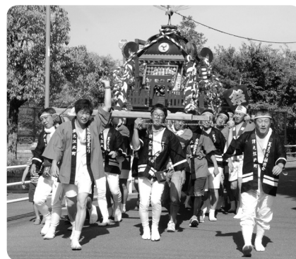
多世代が集いつながる津之江北町夏祭り

や地元住民参加型の井戸端会議等を通して、「気軽に立ち寄れる居場所がほしい」、「ご近所さんとの会話が少なくなっているので気軽に声を掛け合える取組をしたい」という声をカタチにしていきたいと思います。