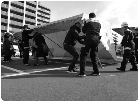
テント立てに初めて挑戦！

今回はテントの組み立てや資機材の準備から始め、災害ボランティアセンターの運営の流れや役割、片付けまでの一連の流れを確認しました。