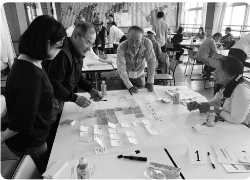
井戸端会議で地域の魅力再発見

市社協では、地区福祉委員会と共に、地域の様々な団体の協力を得ながら、「地区福祉活動計画」の策定を地域全体で取り組んでいます。この取組は、これまでの地域の活動や現状を振り返り、