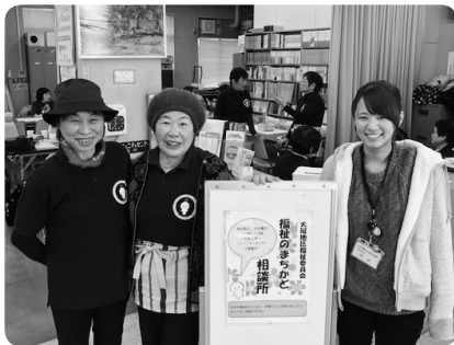
大冠地区福祉委員会のまちかど相談