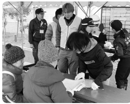
ボランティアへ活動内容を説明中

また、避難所への支援を想定して、大冠・津之江小学校の避難所にボランティアの派遣を行いました。