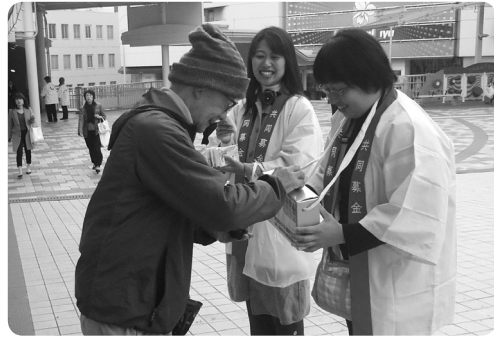
ご協力ありがとうございます！