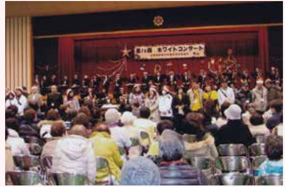
五領地区青少年健全育成協議会