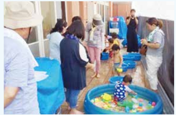
西大冠地区福祉委員会