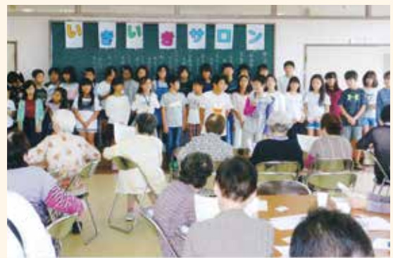
富田地区福祉委員会