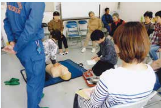
柳川地区福祉委員会