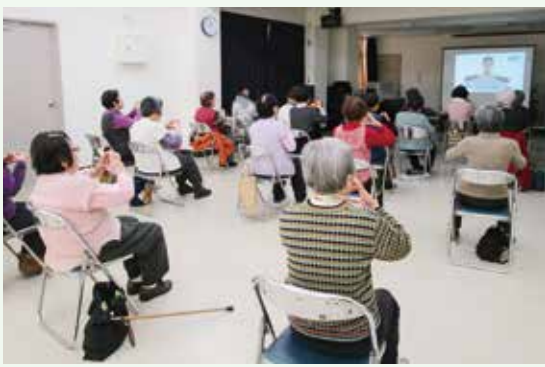
芥川地区福祉委員会