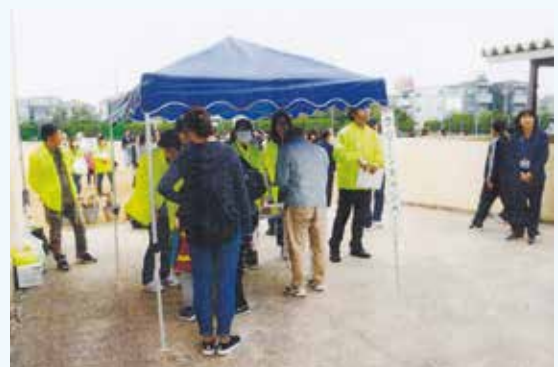
如是中学校区青少年健全育成協議会