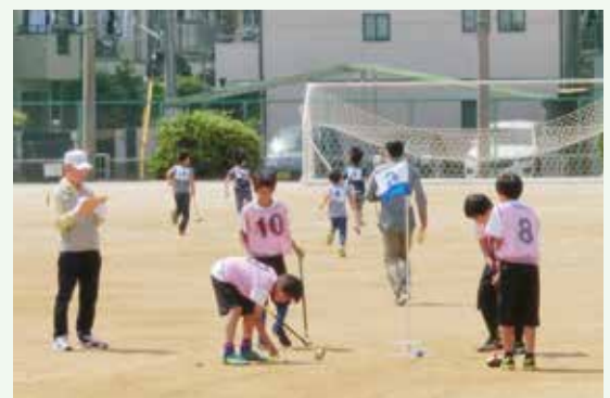
城南校区青少年健全育成会