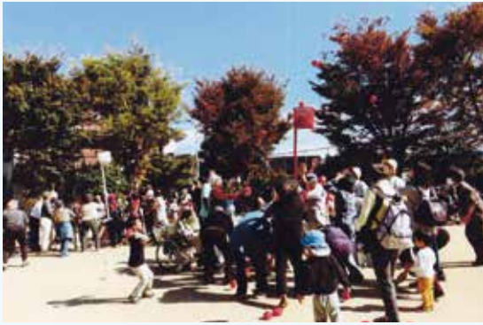
北清水地区福祉委員会