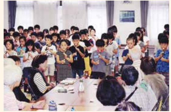
真上地区福祉委員会