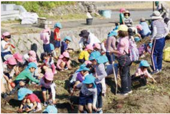
清水地区福祉委員会