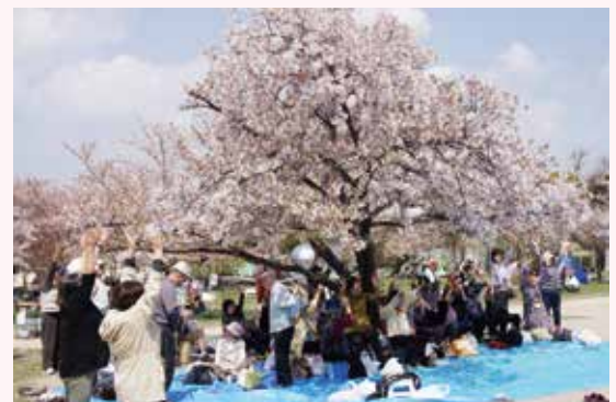
桃園地区福祉委員会