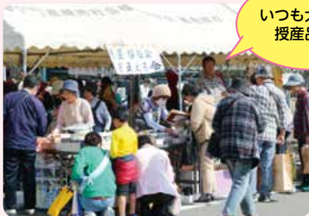
いつも大人気の授産品販売