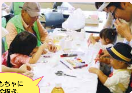
おもちゃにお絵描き、楽しかったよ♡

なお、バザー売上金13万1700円は、ボランティア基金や災害支援などに活用します。ご協力ありがとうございました。