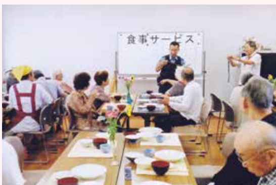
津之江地区福祉委員会