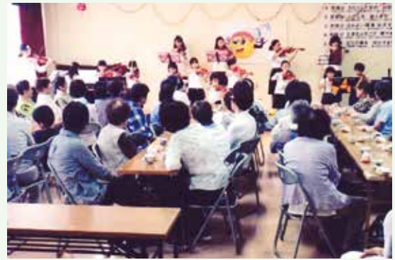
赤大路地区福祉委員会