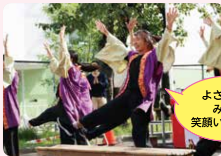
よさこいでみんな笑顔いっぱい!!