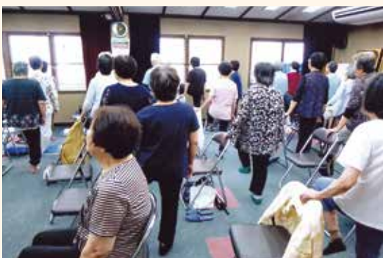
桜台地区福祉委員会