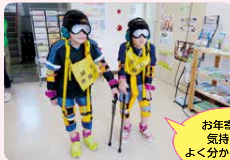
お年寄りの気持ちがよく分かりました