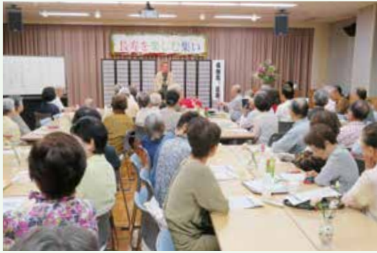
阿武山地区福祉委員会