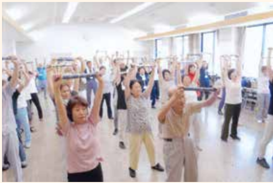
中阿武野地区福祉委員会