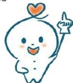
高槻市社協イメージキャラクター タッピー