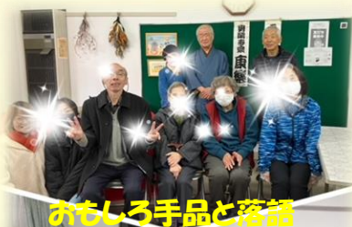
おもしろ手品と落語