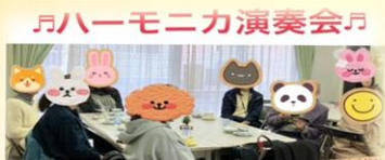
♪ハーモニカ演奏会♪ 2024年 12月 11日