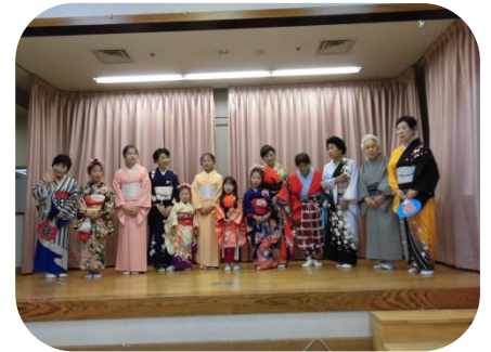
多佳美会のみなさん、ありがとうございました。