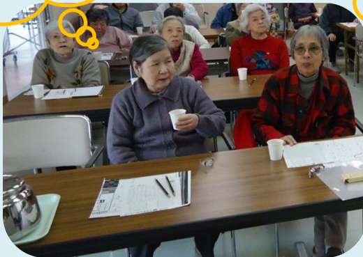
3時間目は、計算のお勉強!