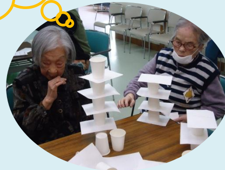
紙コップを高く積み上げるゲームをしました。